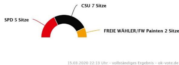
Markt Painten – Gesamtergebnis – Sitzverteilung Wahl des Marktgemeinderates 15.03.2020